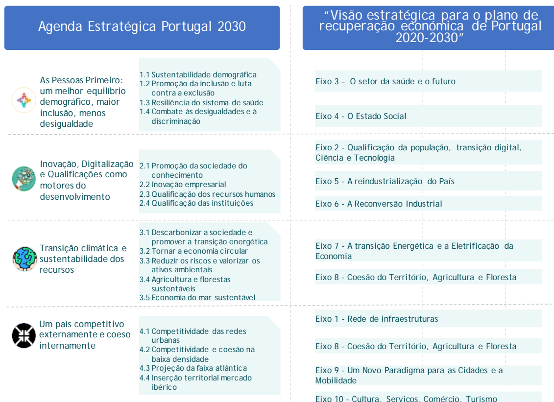
Figura 4. Agendas Temáticas da Estratégia Portugal 2030 e a Visão Estratégica

A Estratégia Portugal 2030 assume-se assim como a base estratégica para documentos de natureza programática transversal, como são as Grandes Opções e o Programa Nacional de Reformas, bem como dos programas estratégicos de mobilização de fundos europeus (Acordo de Parceria, PRR e o PEPAC) e os programas e planos setoriais que a venham a concretizar.