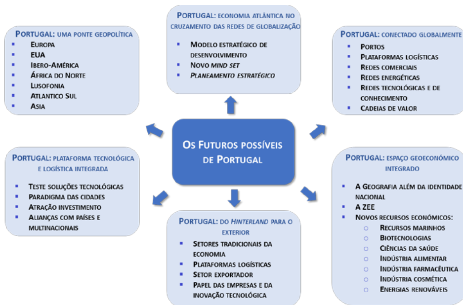
Figura 2. Futuros possíveis de Portugal

Fonte: “Visão Estratégica para o Plano de Recuperação Económica de Portugal 2020-2030”, António Costa Silva, figura 3, pp. 26, Lisboa, 21.jul.2020.