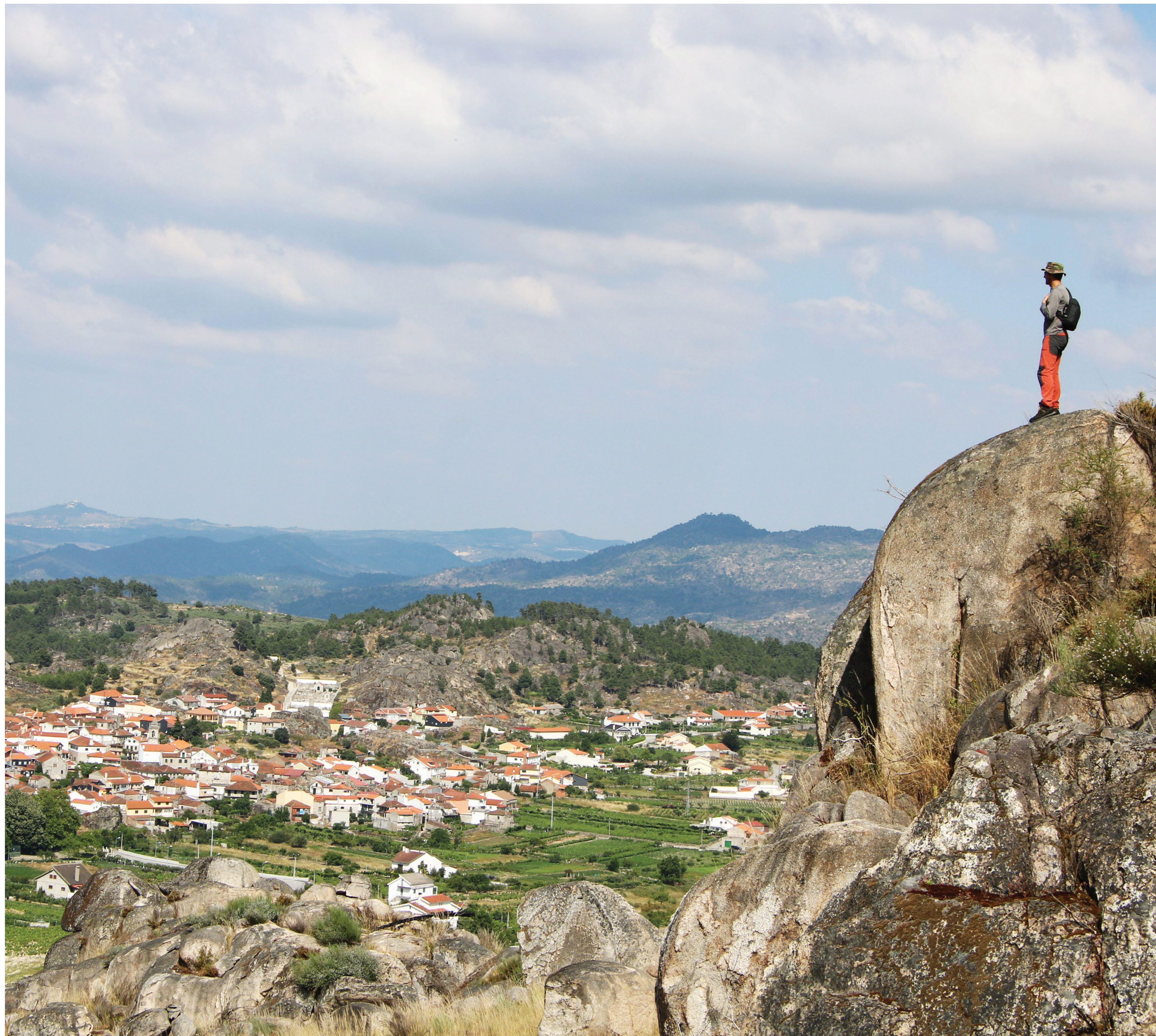
PR4 ALJ TRILHO DE SANTA EUGÉNIA - CARLÃO FREGUESIA DE SANTA EUGÉNIA / UNIÃO DAS FREGUESIAS DE CARLÃO E AMIEIRO - ALIJÓ